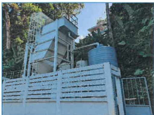
อาคารปรับปรุงคุณภาพน้ำ

โครงการจัดให้มีระบบปรับปรุงคุณภาพน้ำใช้ เพื่อปรับค่าความเป็นกรดเป็นด่างให้อยู่ในเกณฑ์ มาตรฐาน และจัดให้มีถังเก็บน้ำใต้ดิน จำนวน 1 ถัง ปริมาตร 450 ลูกบาศก์เมตร