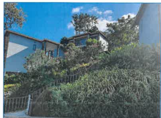
พื้นที่สีเขียวของโครงการ