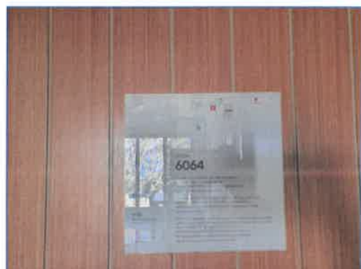
จุดรวมพลของโครงการ