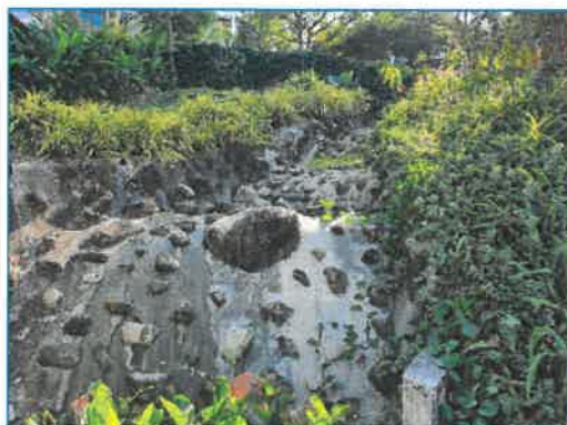
ระบบระบายน้ำฝน