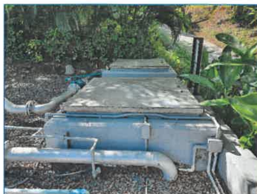
ถังเก็บน้ำใช้