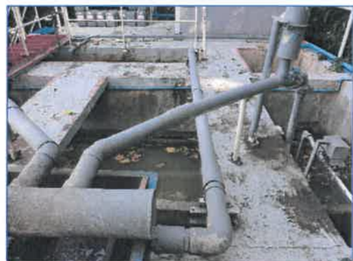
ระบบบำบัดน้ำเสีย