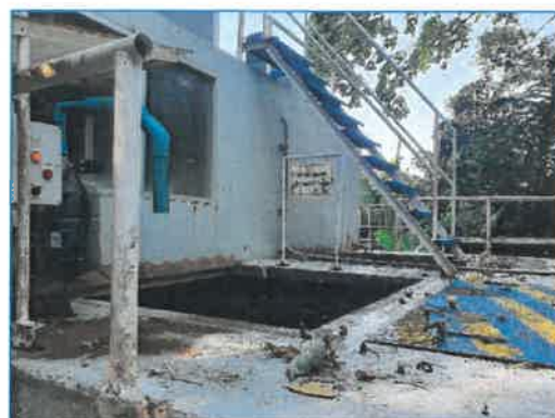
ระบบคลอรีน