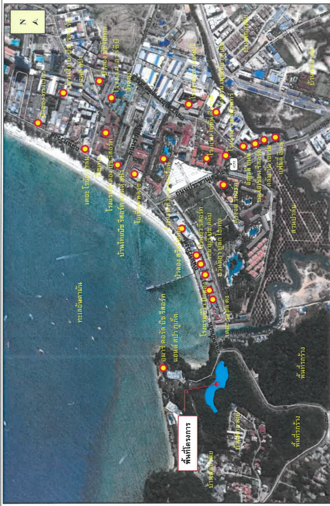
รูปที่ 1-1 ขั้นตอนโครงการ

รายงานผลการปฏิบัติตามการป้องกันและแก้ไขผลกระทบสิ่งแวดล้อม และมาตรการการติดตามตรวจสอบคุณภาพสิ่งแวดล้อม โครงการอาคารอยู่อาศัยรวม อมรี ป่าตอง ของบริษัท อมรี เอ็นแทก ภูเก็ต จำกัด ระหว่างเดือนมกราคม-มิถุนายน 2565 (ระยะดำเนินการ)