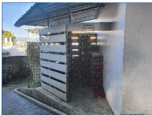
ห้องพักขยะรวม