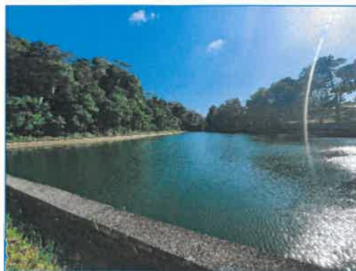
แหล่งน้ำดิบของโครงการ